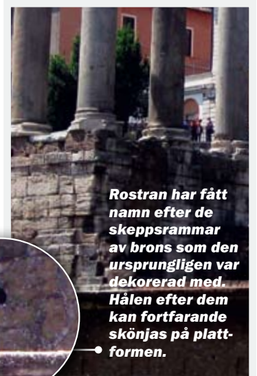
Rostran har fått namn efter de skeppssrammar av brons som den ursprungligen var dekorerad med. Hålen efter dem kan fortfarande skönjas på plattformen.