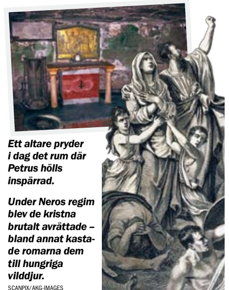
Ett altare pryder i dag det rum där Petrus hölls inspärrad.