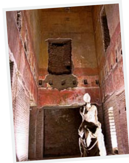
Tak och väggar i Domus aurea var dekorerade med bl.a. ädelstenar, elfenben och färgrika fresker.

Ibland kan området vara avspärrat eftersom arkeologer arbetar för högtryck med att rädda de unika väggmålningarna från fuktskador och jordskred.